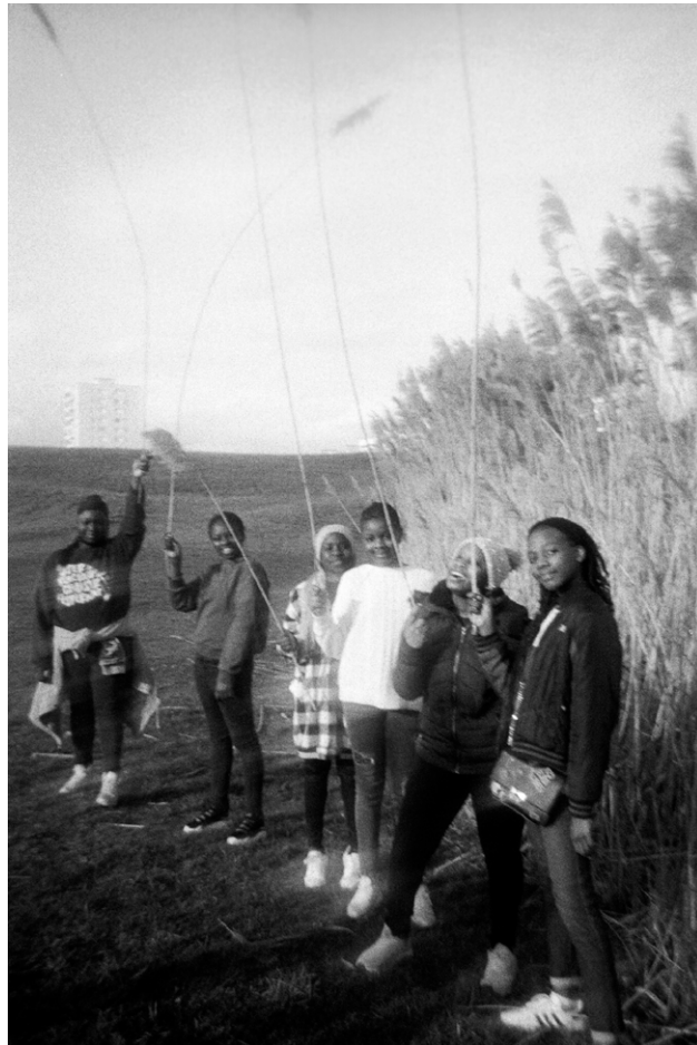
Collège Jules Verne, Les Mureaux, 2022-2023

Ce premier atelier était une introduction à la pratique de la photographie argentique auprès des classes de 3ème.